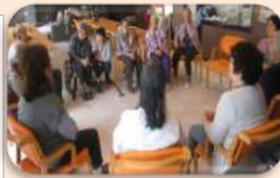
迷った時は皆様と一緒に考えておりました