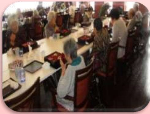
皆様大好評でした!!