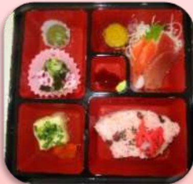
↑どれもおいしそうです