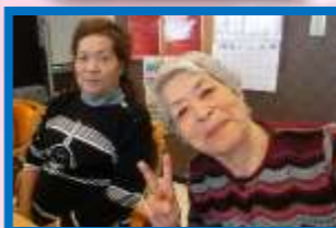
お祝いを兼ねて一緒にピース♪