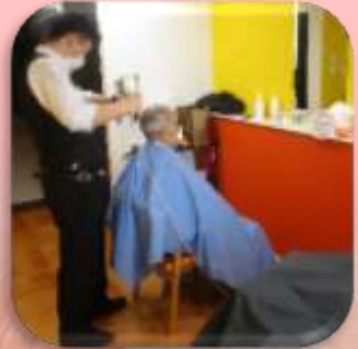
理美容室の様子です