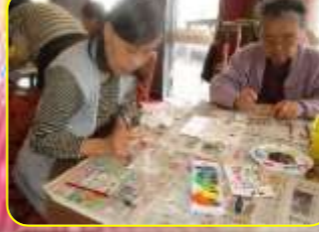
早苗クラブ様の作品がこちらになります。