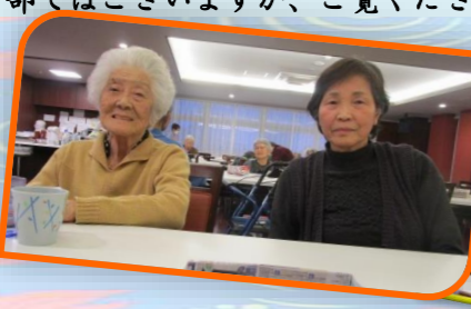
DS利用先が一緒のお2人！